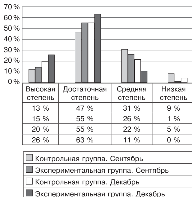
Рис. 2. Сравнительная диаграмма адаптации первоклассников на начало и конец эксперимента

Высокая степень адаптации детей экспериментальной группы на 6 % превышает показатели детей-выпускников других дошкольных учреждений (на начало эксперимента было 2 %): активно работают на уроке, часто поднимают руку, при усвоении знаний правильно выполняют школьные за-