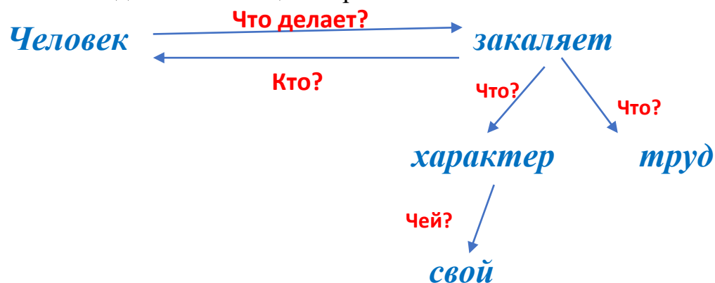
Схема на доске с помощью карточек.

Упр. 65, с. 47 , составить из предложений текст.